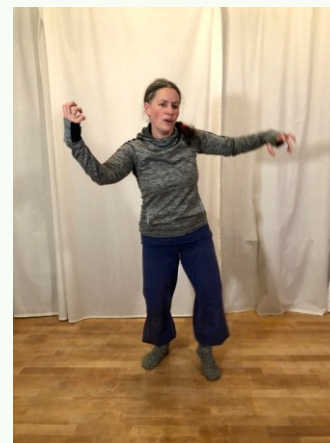
Dieses Projekt findet in Kooperation mit dem Vorstand des Vereins KB Allgäu und dem Landesverband Epilepsie Bayern e. V. statt und wird gefördert durch die gesetzlichen Krankenkassen und deren Verbände in Bayern

Anmeldung: epilepsieberatung@kb-allgaeu.de