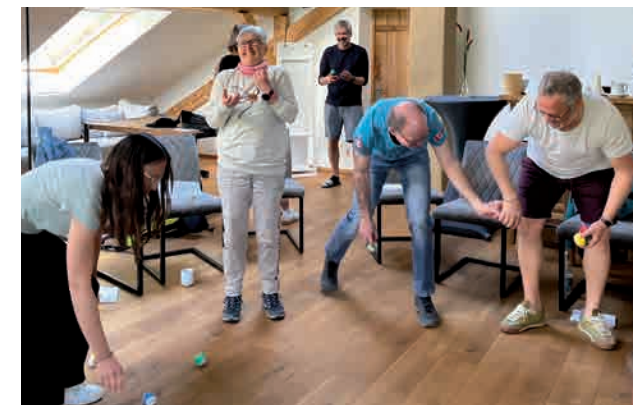
Führungskräfteentwicklung - Haltung entscheidet