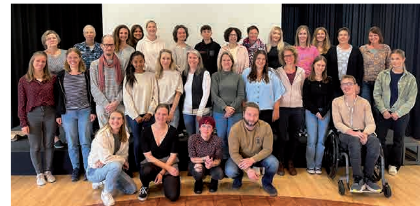
Unsere neuen Mitarbeitenden auf der Einführungsveranstaltung