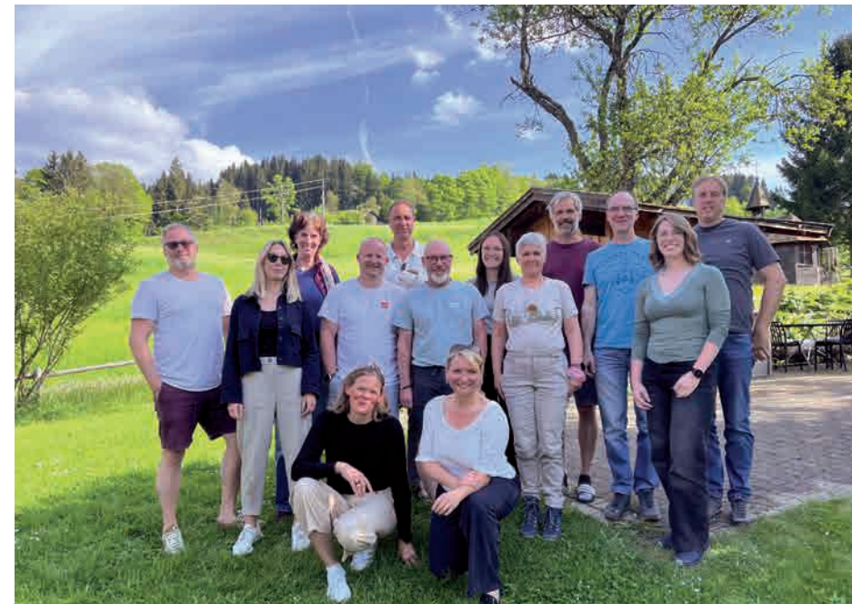
Führungskräfteentwicklung - Haltung entscheidet