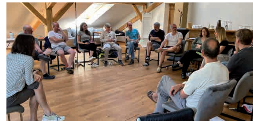
Führungskräfteentwicklung - Haltung entscheidet