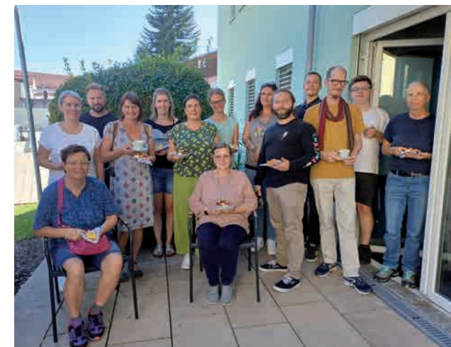
Kaffee & Kuchen nach dem Rundgang mit unseren neuen Mitarbeitenden